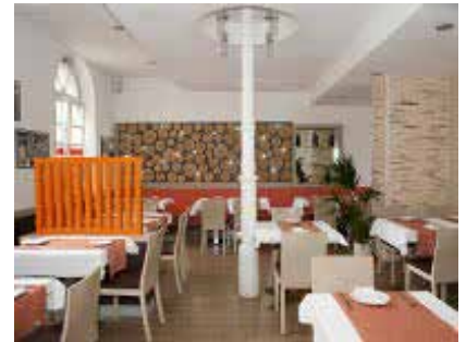
Pomodoro e Basilico

In Bad Mergentheim muss man sich als Studi in der Mittagspause nicht nach Hause schleppen, um sich dort ein mageres Brot zu schmieren oder hastig ein paar Nudeln abzukochen. Stattdessen hat man die weitaus luxuriösere Option auf einen Mittagschmaus in ortsansässigen Gaststätten, ohne dass gleich der Pleitegeier über einem kreist. Das ist nicht nur geselliger, sondern im Zweifelsfall sogar günstiger: Nur 2,70 Euro kosten die Essensmarken (erhältlich in der DHBW-Verwaltung), die, einer Kooperation zwischen Studierendenwerk Heidelberg und Gastwirten sei Dank, in vier fußläufig zum Campus gelegenen Lokalen auf ihren Einsatz warten. Aktuelle Speisepläne findet man am Schwarzen Brett und online auf der Website des Studierendenwerks Heidelberg.